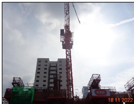
รูปที่ 1-2 สภาพปัจจุบันของโครงการ